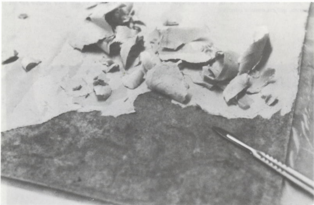
Figures 1 et 2

La première opération de restauration est, dans de nombreux cas, la mise à nu des documents: tous les supports-toile (figure 1) ou papier de renfort (figure 2), sont enlevés avec de l'eau (figure 1) ou de la colle (figure 2).